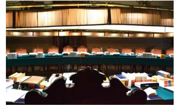
Salón de plenos

Los académicos son elegidos, en votación secreta y por mayoría de votos, por los propios componentes de la institución, previa propuesta de candidaturas por parte de un grupo de tres de ellos. Las normas electorales están recogidas en los Estatutos de la RAE y