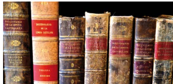
Ediciones del diccionario académico

Entre 2013 y 2015 la RAE ha conmemorado su tricentenario con diversas actividades desarrolladas dentro y fuera de la sede académica, y, especialmente, con una nueva edición del Diccionario de la lengua española —la vigesimotercera—, publicada en octubre de 2014. El diccionario académico, al igual que otros diccionarios y recursos de la institución, está disponible gratuitamente en la red (rae.es).