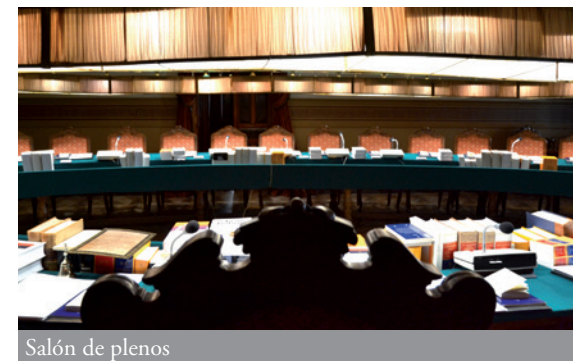
Salón de plenos

Los académicos son elegidos, en votación secreta y por mayoría de sufragios, por los propios componentes de la institución, previa propuesta de candidaturas por parte de un grupo de tres de ellos. Las normas electorales están recogidas en los Estatutos de la RAE y en el