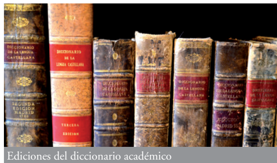
Ediciones del diccionario académico

Entre 2013 y 2015 la RAE conmemoró su tricentenario con diversas actividades desarrolladas dentro y fuera de la sede académica, y, especialmente, con una nueva edición del Diccionario de la lengua española —la vigesimotercera—, publicada en octubre de 2014. Esta edición del diccionario académico está disponible gratuitamente en la red (rae.es) gracias al apoyo de Obra Social «la Caixa».