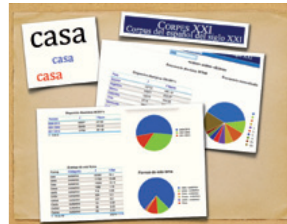
El CORPES XXI es un proyecto panhispánico.

fecha, etc.) y aquellos que lo sitúan en cada uno de los subconjuntos en que puede ser analizado el corpus: zona, país, procedencia (libro, prensa, internet, oral), área temática (actualidad, economía, deportes, etc.) y tipo de texto (académico, noticia, biografía, etc.). El sistema de codificación, en XML y basado en la Text Encoding Initiative , ha sido desarrollado íntegramente en la RAE. Cada uno de estos parámetros de selección puede ser combinado con todos los demás, de modo que es posible obtener los casos de una palabra o expresión procedentes de, por ejemplo, noticias de prensa publicadas en Panamá en 2010 y que traten de economía. La aplicación de consulta permite siempre la opción de obtener directamente los ejemplos o bien trabajar primero con los datos estadísticos generales y luego ir seleccionando los subconjuntos que interesan. En todos los casos, la aplicación facilita la frecuencia general y la normalizada (en número de casos por millón de formas).