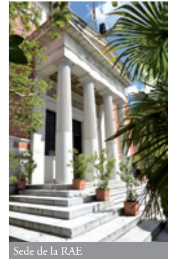
Sede de la RAE