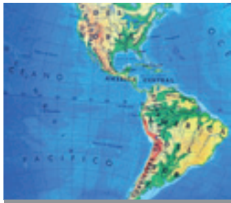
El 70 % de las formas seleccionadas proceden de América.

desarrollada hace quince años, está necesitada de adaptación a las posibilidades actuales de la informática.