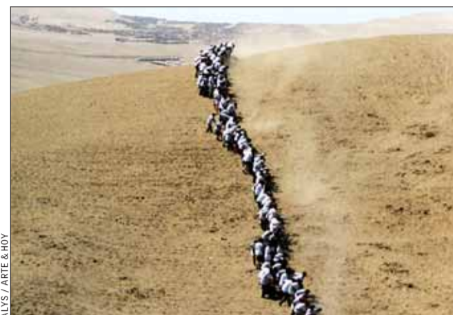
ALYS / ARTE & HOY