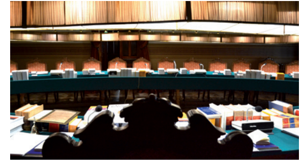
Salón de plenos

Los académicos son elegidos, en votación secreta y por mayoría de sufragios, por los propios componentes de la institución, previa propuesta de candidaturas por parte de un grupo de tres de ellos. Las normas electo-