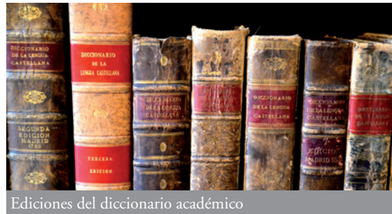
Ediciones del diccionario académico

Entre 2013 y 2015 la RAE conmemoró su tricenario con diversas actividades desarrolladas dentro y fuera de la sede académica, y, especialmente, con una nueva edición del Diccionario de la lengua española —la vigesimotercera—, publicada en octubre de 2014. Esta edición del diccionario académico, al igual que otros diccionarios y recursos de la institución, está disponible gratuitamente en la red (rae.es) gracias al apoyo de Obra Social «la Caixa».